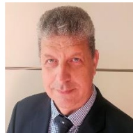
Αντιπρότανης Οικονομικών & Ηλεκτρονικής Διακυβέρνησης Ευθύμιος Προβίδας Καθηγητής, Τμήμα Περιβάλλοντος